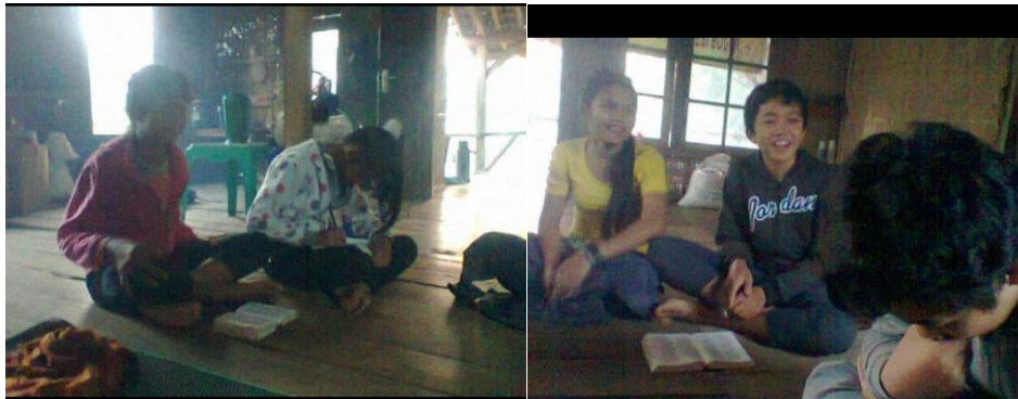
Gambar 2 Proses pendampingan

Dengan mengimplementasikan aplikasi game edukasi dalam pembelajaran Alkitab di GGP Sanggabuana, diharapkan minat dan efektivitas pembelajaran anak-anak dapat meningkat. Anak-anak akan lebih terlibat, antusias, dan enjoy dalam belajar nilai-nilai agama melalui pengalaman menyenangkan yang ditawarkan oleh aplikasi ini.